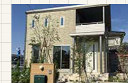
ハイムプレイス楽市 1号地 (SmartPowerStation FR)

延床面積 109.52㎡ (33.12坪) 〔1F面積〕61.72㎡(18.67坪) 〔2F面積〕47.80㎡(14.45坪)