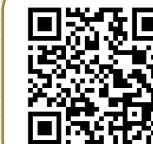
この物件を スマホで見る