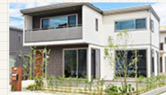
グレイスタウン青山2-8-2号地 (バルフェ)

延床面積 116.83m 2 (35.34坪) [1F面積] 58.83m 2 (17.79坪) [2F面積] 58.00m 2 (17.54坪)