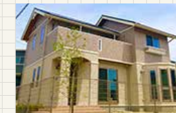
ポートウエストみなと坂 10号地 (グランツユーV)

[1F面積] 62.66㎡ (18.95坪) [2F面積] 51.44㎡ (15.44坪)