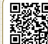
この物件を スマホで見る