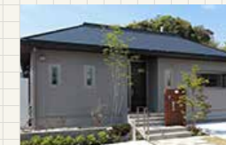
スマートハイムプレイス天辰 3号地 (SmartPowerStation GR)