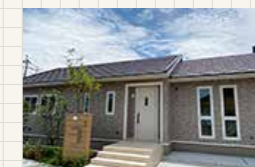
ラソス・デ始良 2号地 (グランツーユー V)