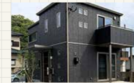
ユーエムヒルズひなみ野Ⅲ 1号地 (SmartPowerStation-Urban)

[1F面積] 47.67m 2 (14.42坪) [2F面積] 47.67m 2 (14.42坪)