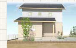
サウスガーデンひびきの32号地 (グランツーユーV)

延床面積 112.26m 2 (33.95坪) 〔1F面積〕60.42m 2 (18.27坪) 〔2F面積〕51.84m 2 (15.68坪)