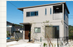
ポートウエストみなと坂 39号地 (SmartPowerStation Urban)

延床面積 111.26m 2 (33.65坪) 〔1F面積〕55.14m 2 (16.67坪) 〔2F面積〕56.12m 2 (16.97坪)