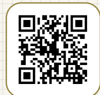
この物件を スマホで見る