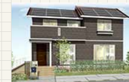
サウスガーデンひびきの 25号地 (グランツーユーV)

[1F面積] 61.35m 2 (18.55坪) [2F面積] 53.42m 2 (16.15坪)