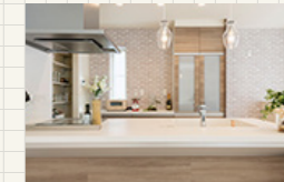
ポートウエストみなと坂 35号地 (グランツーユーV)

延床面積 113.13㎡ (34.22坪) 〔1F面積〕62.51㎡(18.90坪) 〔2F面積〕50.62㎡(15.31坪)