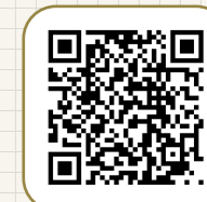
この物件を スマホで見る