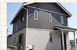
浅川テラス10-1号地 (グランツーユーV)

延床面積 119.64㎡ (36.19坪) 〔1F面積〕 64.58㎡ (19.53坪) 〔2F面積〕 55.06㎡ (16.65坪)