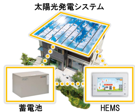
3 点セット (PV、蓄電池、HEMS) を全邸で搭載

『ユナイテッドハイムパーク糸島』は、全邸に高断熱仕様と PV (4kW 以上推奨) を搭載し、ZEH 区分の中でも Nearly ZEH、ZEH Oriented を含まないエネルギー削減率が最高ランクの『ZEH』とします。加えて、エネルギー自給自足率を高める蓄電池 (9.9kWh *6 以上推奨) と、効率的に電力をコントロールする独自の HEMS も全邸で採用。可能な限り自然エネルギーを活用し電力不安の少ない暮らしを実現します。