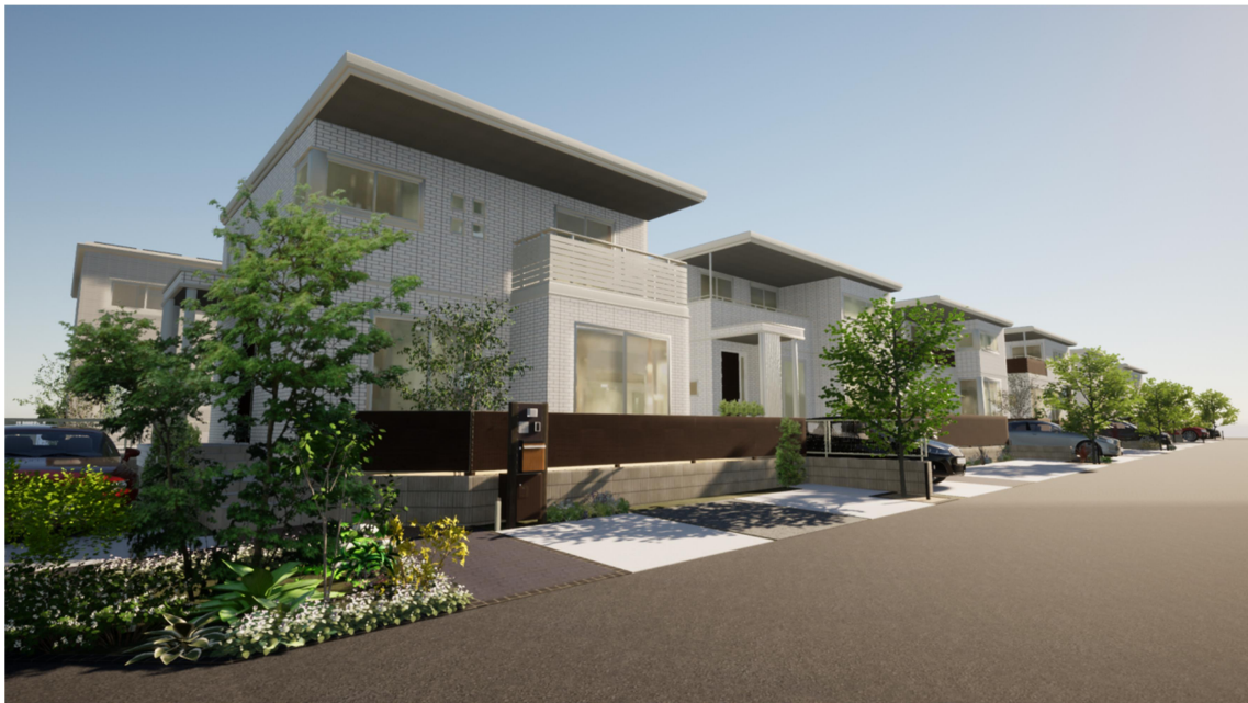
『ユナイテッドハイムパーク糸島』まちなみイメージ

所在地：福岡県糸島市板持字蔵ノ元 33 番 1 他 交通：JR 筑肥線 波多江駅 徒歩 17 分 開発面積：16.237.88 m 2 地目：田 用途地域：無 建ぺい率・容積率：50%・80% 事業主・売主：セキスイハイム九州株式会社 設備等の概要：公営水道、公共下水道、個別プロパンガス、電力供給有 道路：幅員 5.5m～6.5m（アスファルト舗装） 造成完了年月日：2023 年 5 月下旬（完了予定） 総区画数：52 区画 第一期販売区画数：12 区画 販売区画面積：202.97 m 2 ～203.00 m 2 （予定） 販売価格：未定