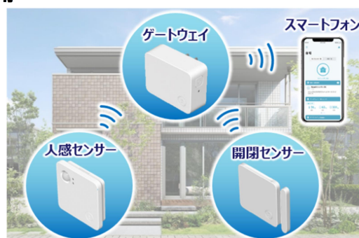
窓などからの侵入を検知するホームセキュリティ

まち全体で防犯意識を向上させることで、安心して長く暮らせるまちづくりを目指します。