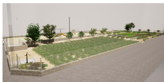
『共同菜園×隣接公園』のイメージ

共同菜園と隣接公園がつながるコミュニティをデザインし、多世代にわたって交流が続くサステナブルなまちを目指します。