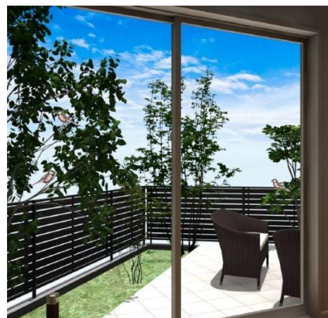
暮らしに潤いを与えるガーデンツリー