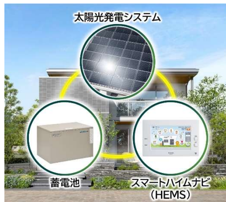
3 点セット(PV、蓄電池、HEMS)を全邸で搭載

『ユナイテッドハイムパーク古賀』は、全邸に高断熱仕様と PV (4kW 以上推奨) を搭載し、ZEH 区分の中でも Nearly ZEH、ZEH Oriented を含まないエネルギー削減率が最高ランクの『ZEH』とします。加えて、エネルギー自給自足率を高める蓄電池 (4kWh ※5 以上推奨) と、効率的に電力をコントロールする独自の HEMS 「スマートハイムナビ」も全邸で採用。可能な限り自然エネルギーを活用し電力不安の少ない暮らしを実現します。