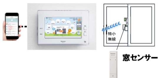
窓施錠開閉見守りシステム

まち全体で防犯意識を向上させることで、安心して長く暮らせるまちづくりを目指します。