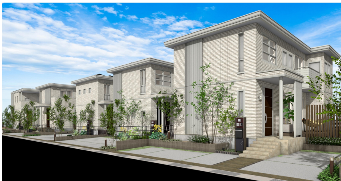
『ユナイテッドハイムパーク古賀』まちなみイメージ ※6

所在地：福岡県古賀市古賀字向浜 1339 番 85 他 交通：JR 鹿児島本線 古賀駅 徒歩 15 分 開発面積：3,123.25 m 2 地目：雑種地 用途地域：第一種住居地域 建ぺい率・容積率：60%・200% 売主：セキスイハイム九州株式会社 設備等の概要：公営水道、公共下水道、個別プロパンガス、電力供給有 道路：幅員 6m (アスファルト舗装) 造成完了年月日：2023 年 10 月末 (完了予定) 総区画数：12 区画 第一期販売区画数：5 区画 販売区画面積：165.20 m 2 ~177.27 m 2 (予定) 販売価格：未定