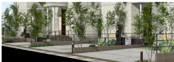
シンボルツリーを中心に緑豊かなロードサイド

照明計画では、各区画に2灯以上の照明を配置。全区画が面するメインストリートに灯かりが連なり、夜の美しい景観を演出します。